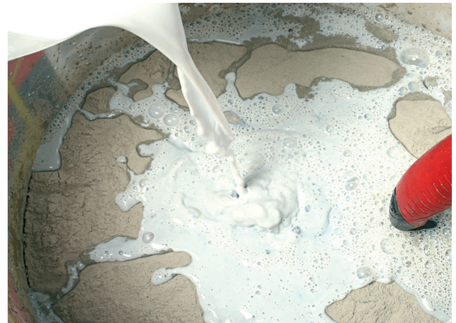
En adjuvantation de l'eau de gâchage

Ce document technique peut faire l'objet de mise à jour, il est de la responsabilité de l'utilisateur de contrôler systématiquement si une version plus récente est disponible sur notre site www.cermix.com . Il est de la responsabilité de l'applicateur de contrôler la compatibilité et l'adéquation des produits pour la réalisation des travaux. Des essais peuvent être réalisés au préalable pour valider le bon comportement des produits.